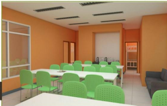
มุมพักผ่อน