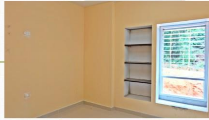
ชั้นวางหนังสือ