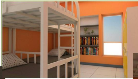
ห้องนอนพร้อมเฟอร์นิเจอร์